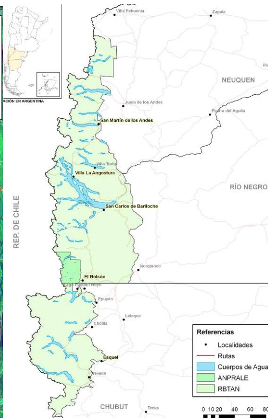
Figura 2. El ANPRALE dentro de la Reserva de Biósfera Transfronteriza Andino Norpatagónica